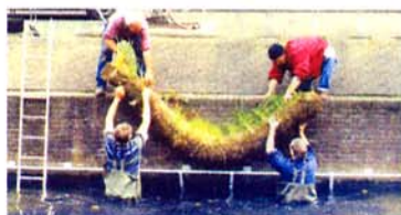
Fixation des berceaux sur une lisse