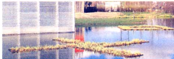
Boudins et géonattes pré-végétalisés : Installation en avril