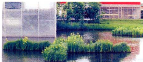
Boudins et géonattes pré-végétalisés : La "floriade" en juin