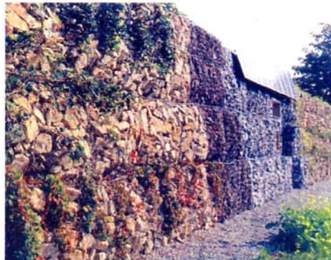
Solution gabions : Ecran antibruit "nature" avec panneaux photovoltaïques

AquaTerra Solutions Les Vincentes - 26270 Clionsclat Tél. : 33 (0) 4 75 63 84 65 Fax : 33 (0) 4 75 63 84 68 E-mail : contact@aquaterra-solutions.com Internet : www.aquaterra-solutions.com/contact